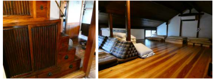
Commode-escalier et étage