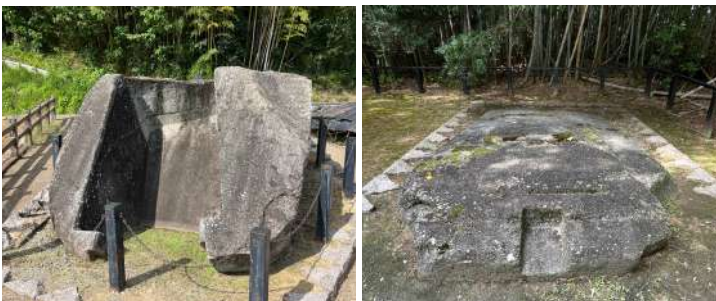
« les latrines de l'ogre »

J'ai trouvé ces pierres lors de ma promenade, et je me suis demandée pourquoi elles avaient été sculptées. Observer ces personnages tout en imaginant le passé est un bon moyen d'en profiter.