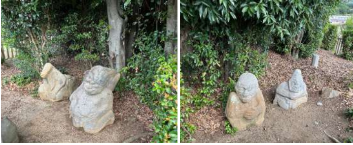
« la femme », « Sannô-gongen », « le bonze » et « l'homme »

Malgré leur nom, parmi les cinq singes de pierre, un seul est en forme de singe. Ce dernier se trouve d'ailleurs dans le bourg voisin de Takatori. Les quatre autres que je vais vous présenter aujourd'hui sont à Asuka. Pour les trouver, il faut aller devant la tombe de Kibihime-no-miko, à cinq minutes à pied de la gare d'Asuka.